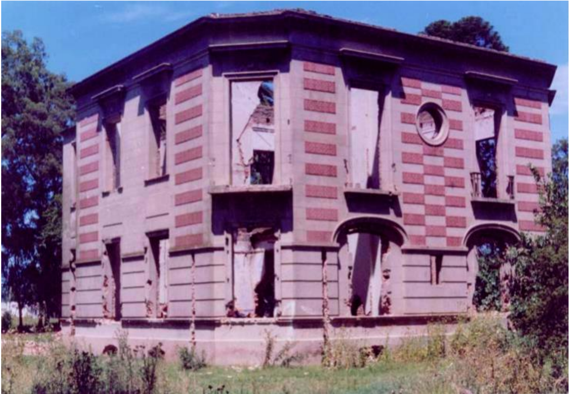
Figura n°1: Casona Mansión Seré en estado de abandono. Fotografía tomada durante enero de 1984 y donada al archivo de la DD.HH. el 17 de noviembre de 2008 por Horacio Peralta, exdetenido desaparecido de la ESMA, quien en ese entonces había ido a ver las condiciones en las que estaba la casona junto a un amigo.