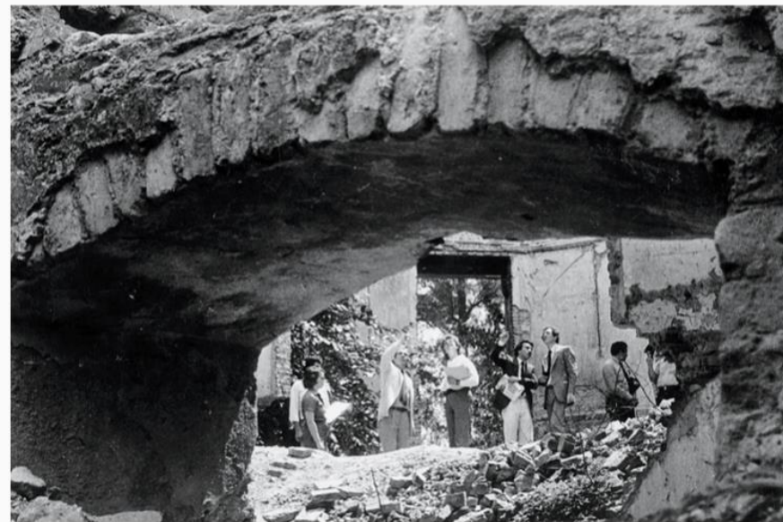
Figuras nº 3 y 4: Imágenes tomadas en el mes de febrero de 1984 por el fotógrafo Zabattaro. Donada al archivo de la DD.HH. de Morón en el año 2003 por Carmen Floriani, quien participara en la instancia de reconocimiento del sitio. Fuente: Archivo de la DD.HH. de Morón.